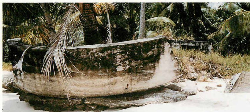
倒壊した4トーチカ