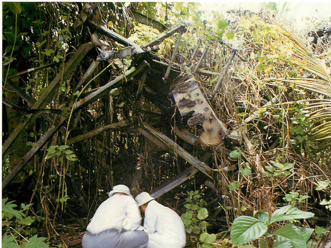
この無線塔にて斃れた戦没者に香を捧げる