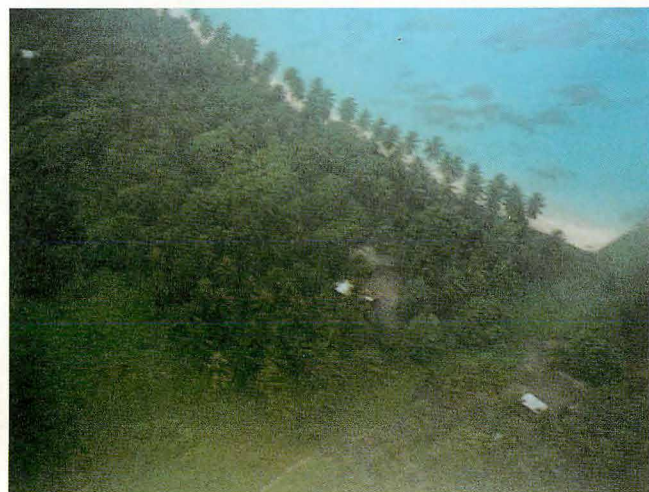
ウオツゼ島俯瞰 802空本部・同水上指揮所が見える