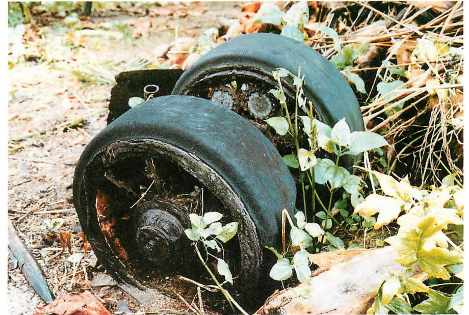
飛行艇用運搬車の大きなタイヤ