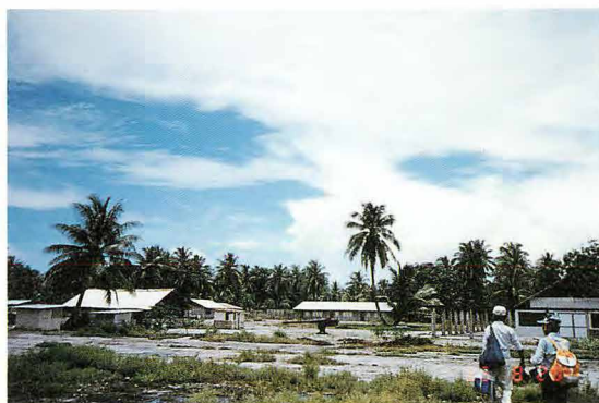
ウオツゼ島村の広場