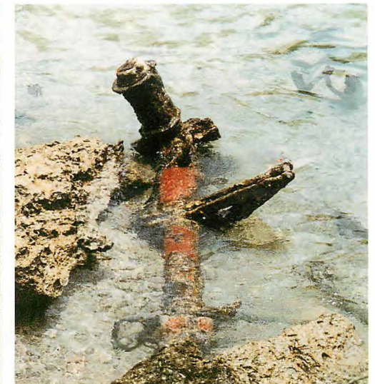
錨残骸(飛行艇棧橋にて)