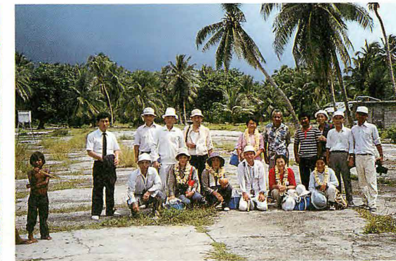
ウオツゼ慰霊参加者