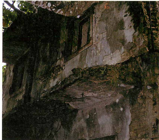
この2階の窓から直撃を受ける