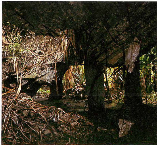
大きく崩壊した1階