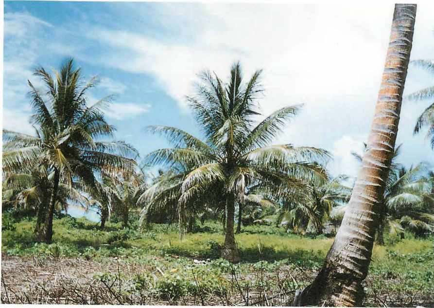
滑走路(NW)から802空本部(内海)方向を望む