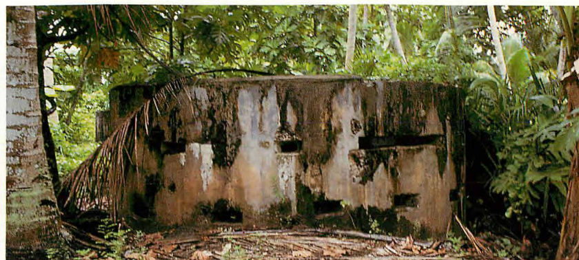
トーチカ化した水槽