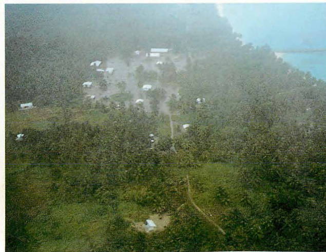
村の広場 531空指揮所が森の中に