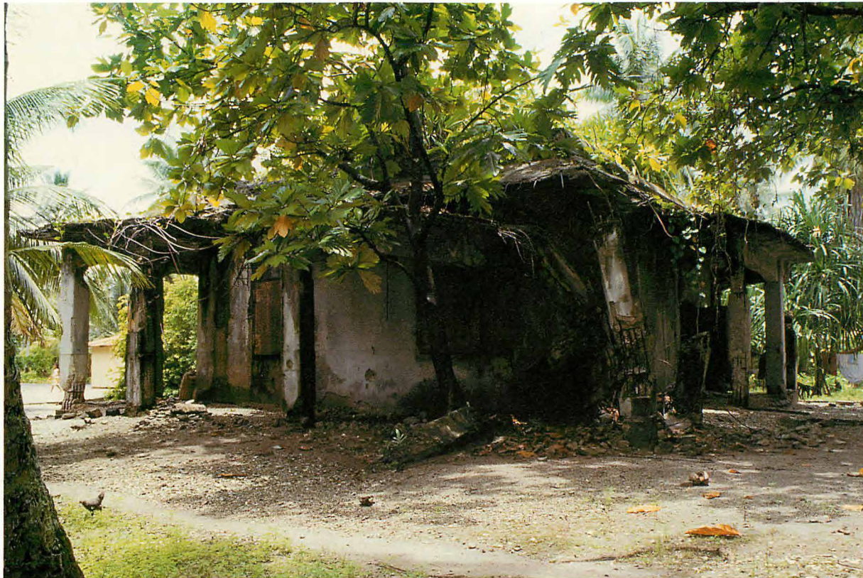
被害軽少、昔の姿を残し、現在も住民が使用