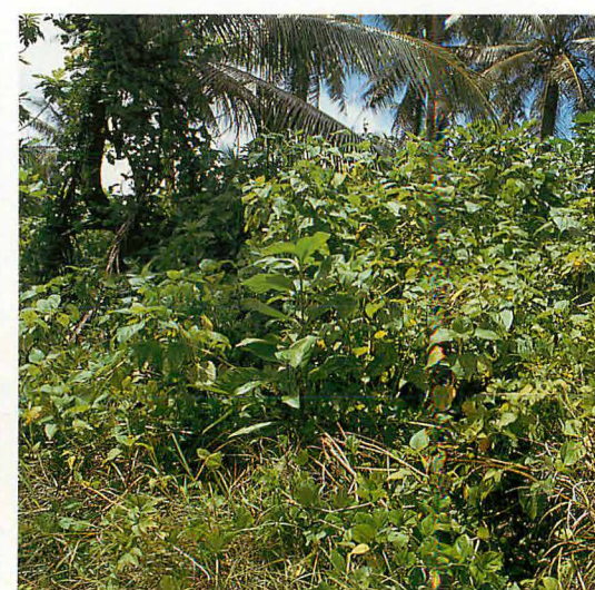
802空指揮官居住壕附近