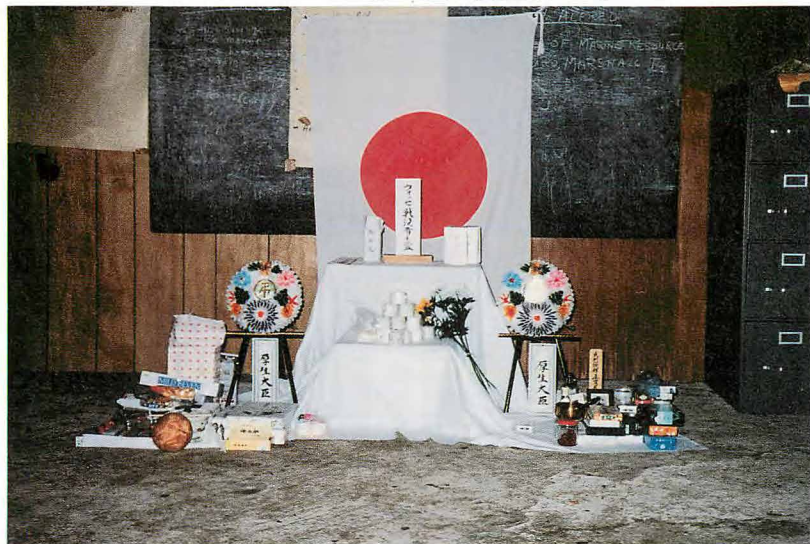
集会所にて戦没者慰霊式