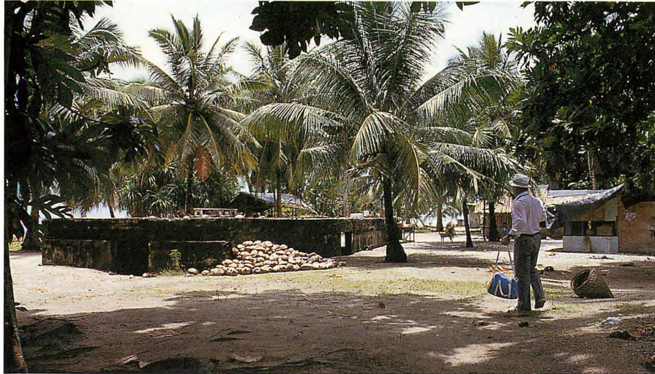
半地下の医務室兼救護室か