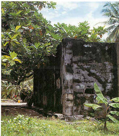
802空本部近くの遺構