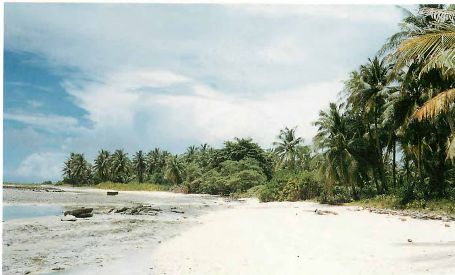
4 トーチカから外海方向を望む