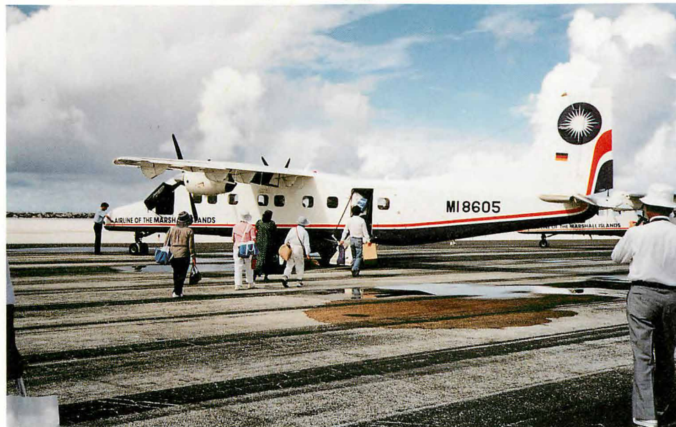
マジュロ飛行場にて