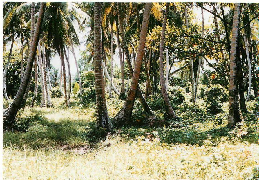
802空陣地中央部附近