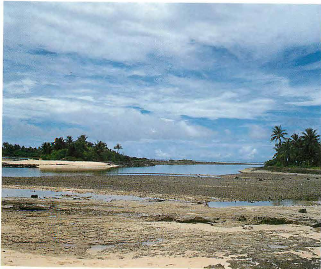
コーロン島を望む