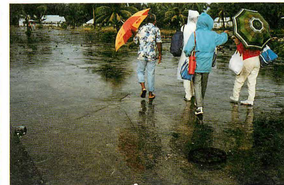
雨の中ウオツゼに着く