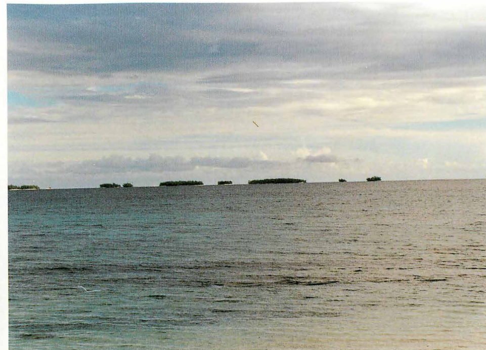
ウオツゼ環礁遠望