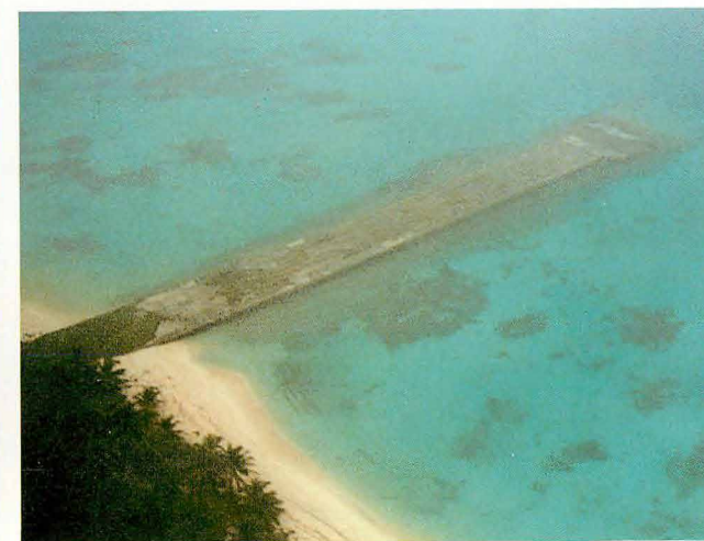
飛行艇棧橋が眼下に