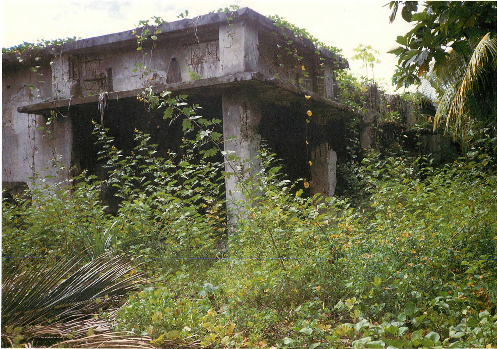
第531海軍航空隊陸上指揮所