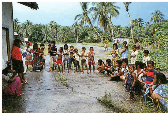
島の子供たちが迎えてくれる