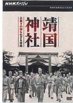
靖国神社 占領下の知られざる攻防 (2010年発売) 58分