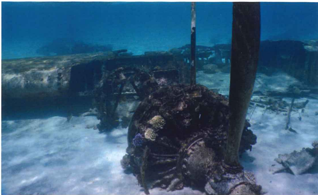
マジURO、ローラ地区のラグーン浅瀬に不時着したB24