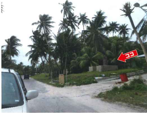
一本道の脇に建っている